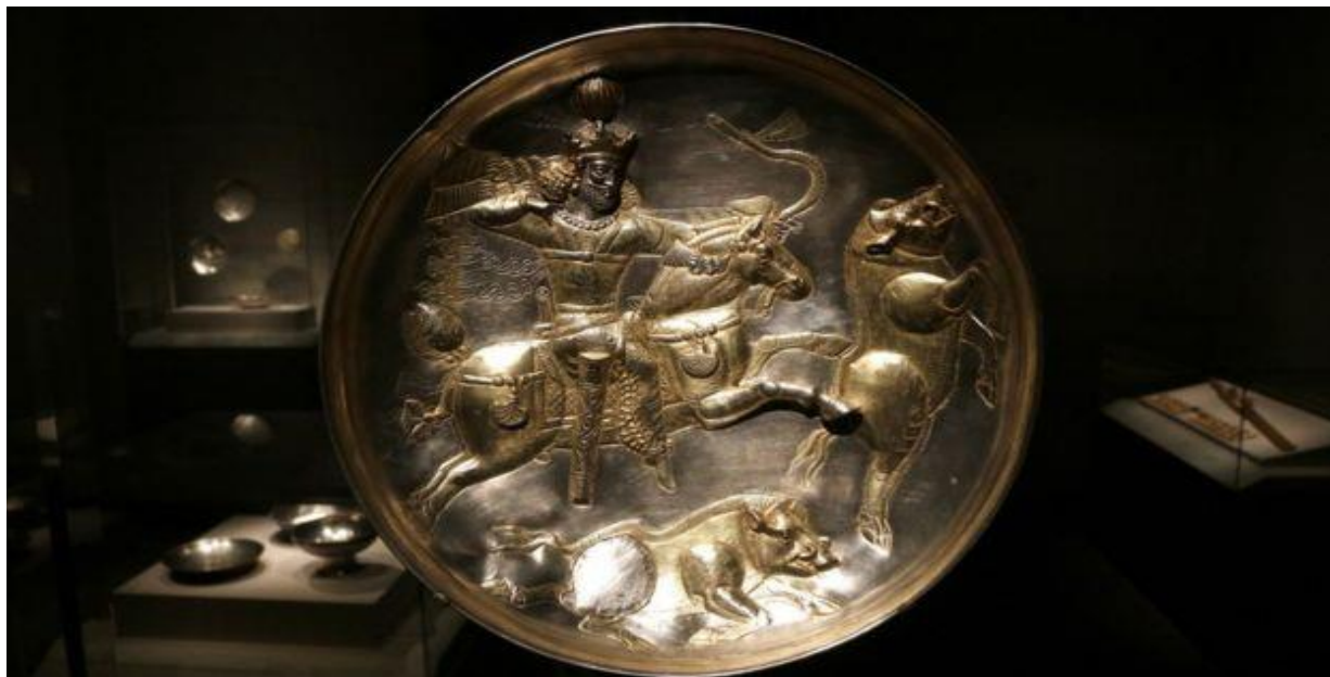
بشقاب شاپور در گالری فریر و سکلر

"بشقاب شاپور" در نگارخانه "فریر و سکلر" یکی از مهم‌ترین آثار مربوط به دوران ساسانی در موزه‌های آمریکا به شمار می‌رود. این اثر پیش از ورود به ایالات متحده، در اختیار خانواده اشرافی استروگانوف در روسیه بود و تا انقلاب ۱۹۱۷ در یکی از کاخ‌های آنها در سنت پترزبورگ قرار داشت.