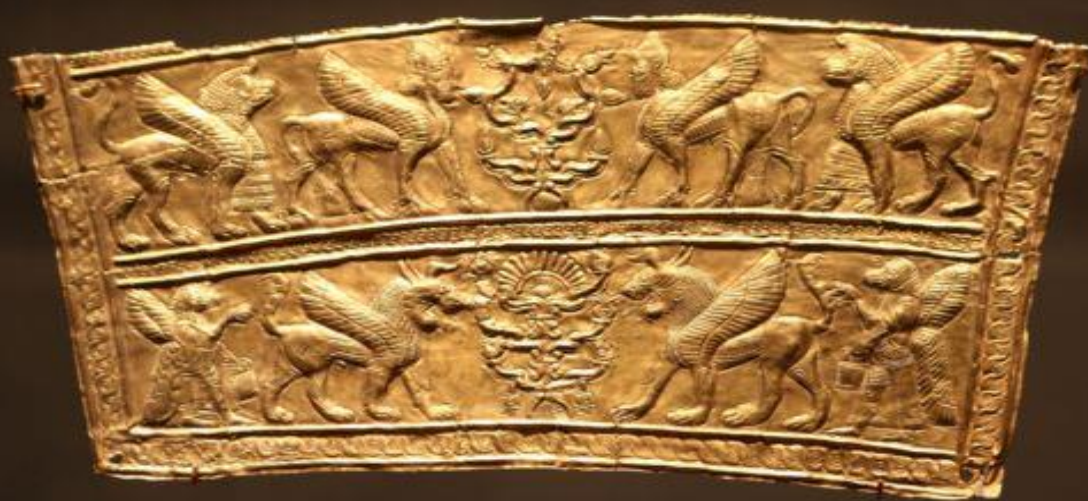
تکه‌از یک زره طلایی ساسانی درنگارخانه فریر سکلر