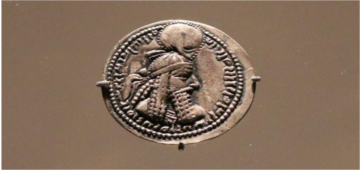
سکه‌ای از دوران اردشیر بابکان، نخستین پادشاه سلسله ساسانی در سده سوم میلادی، در نگارخانه فریر سکلر