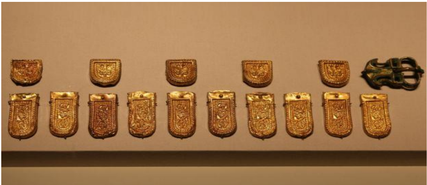
نشان‌های سلطنتی از دوران ساسانیان